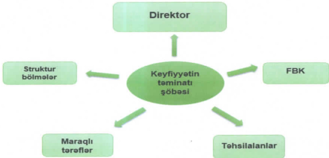
Sxem 3. Keyfiyyət təminatı sistemində strukturlararası əlaqə

FBK- Ümumtəhsil fənn birliyi komissiyasının müəllimləri, Xarici dillər fənn birliyi komissiyasının müəllimləri, Turizm fənn birliyi komissiyasının müəllimləri, Sosial, iqtisadi