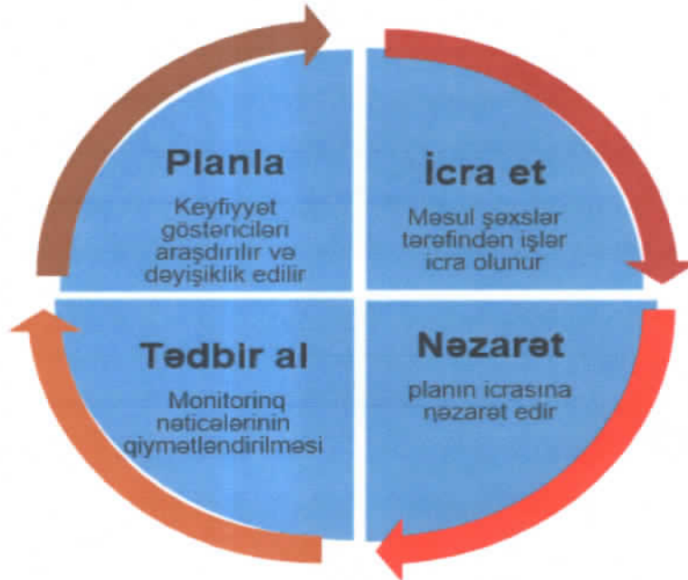
Sxem 1. Görülən işlərin icra mexanizmi

Mingəçevir Turizm Kollecinə kredit sistemi ilə tədrisin təşkili, tədris olunan fənlərin mövzu, hədəf, təlim nəticələri və qiymətləndirmə üsulları, kollecin elektron kitabxanasının zəngin və əlçatanlığı, tələbələrə tətbiq olunan fərdi yanaşma, biliyin qiymətləndirilməsində şəffaflıq və ədalətlik prinsipinin qorunması, tyutor xidmətinin qənaətbəxş səviyyədə təşkili, akademik dürüstlüyə dair təbliğat və kollecdə verilən təhsilin keyfiyyətinin təkmilləşdirilməsi işinin təşkili Keyfiyyət Təminatı sistemi mexanizmi üzrə icra edilmişdir.